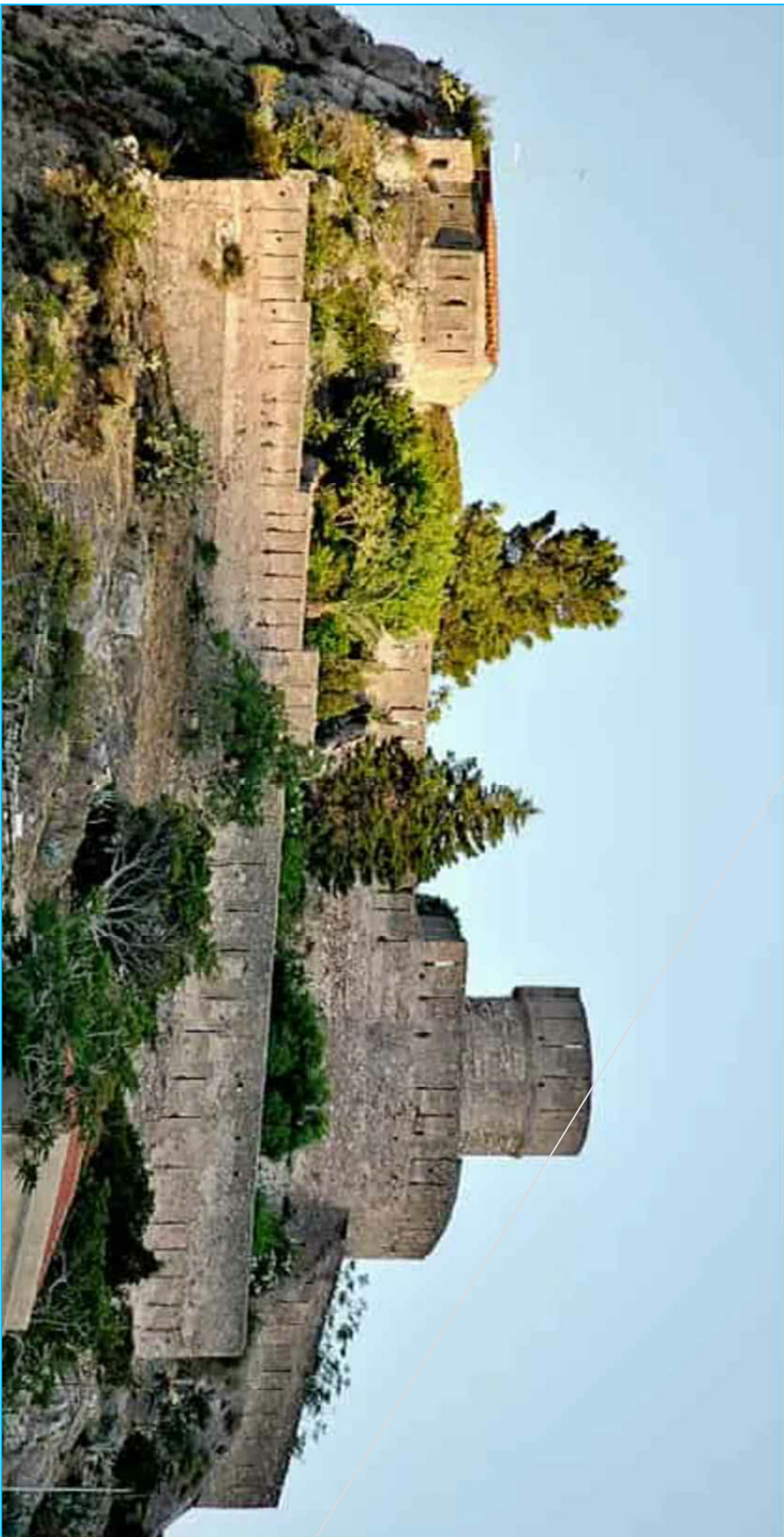
Castello di Sant' Alessio Siculo Posizionamento apparecchi